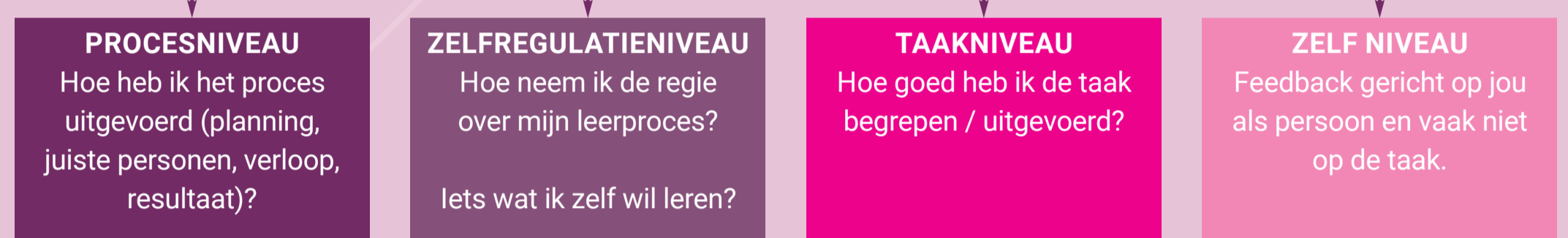
Effectieve feedbackmodel (Hattie & Timperley, 2007)