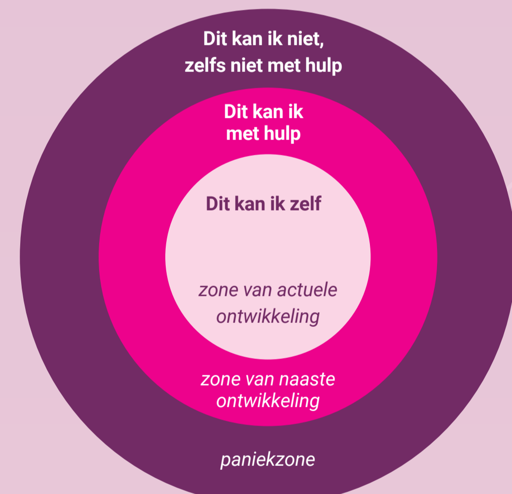
Zones van ontwikkeling (Vygotsky, 1994)

Als je feedback vraagt om bijvoorbeeld jouw leeruitkomsten aan te (gaan) tonen, zorg er dan zoveel mogelijk voor dat de antwoorden je helpen om in de zone van naaste ontwikkeling of actuele ontwikkeling te komen en vooral niet in de paniekzone .